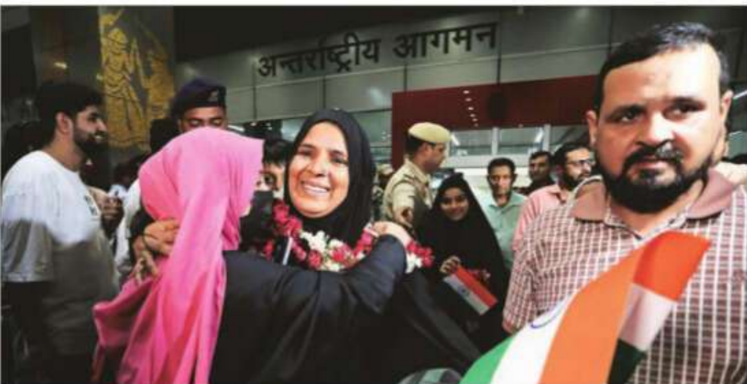
An Indian student returning from Iran reacts after meeting her relatives at the Indira Gandhi International Airport on Saturday

"The citizens of Nepal and Sri Lanka may urgently reach out to the Embassy, either on