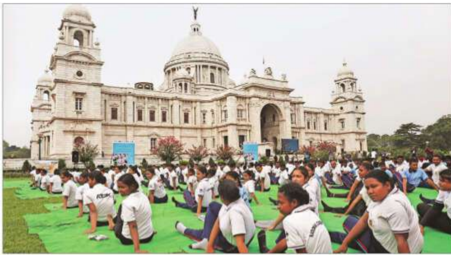
People perform yoga at Victoria Memorial, in Kolkata on Saturday

Tensions between India and Pakistan escalated after the April 22 Pahalgam terror attack, with India carrying out precision strikes on terror infrastructure in Pakistan and Pakistan-occupied Kashmir on May 7.