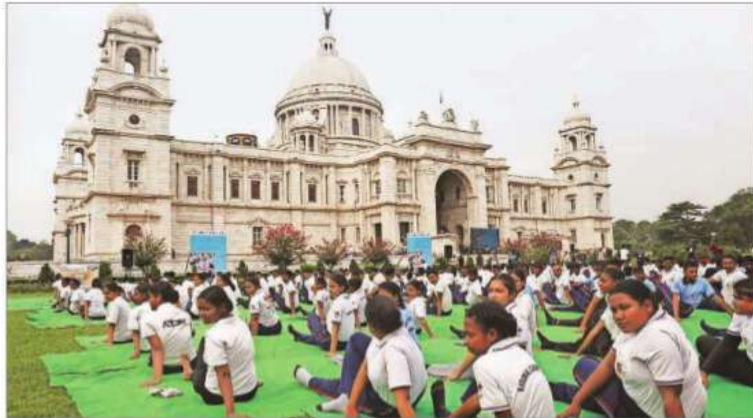
People perform yoga at Victoria Memorial, in Kolkata on Saturday

Tensions between India and Pakistan escalated after the April 22 Pahalgam terror attack, with India carrying out precision strikes on terror infrastructure in Pakistan and Pakistan-occupied Kashmir on May 7.