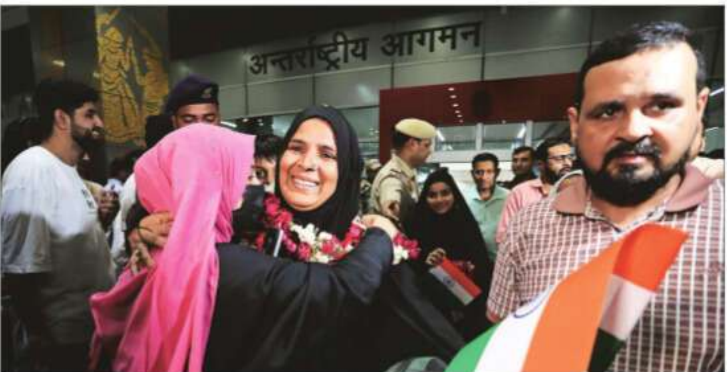
An Indian student returning from Iran reacts after meeting her relatives at the Indira Gandhi International Airport on Saturday

"The citizens of Nepal and Sri Lanka may urgently reach out to the Embassy, either on