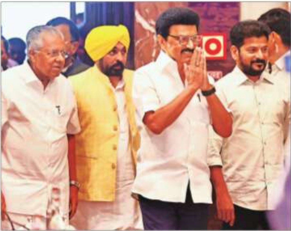
(From left) Kerala chief minister Pinarayi Vijayan, Punjab CM Bhagwant Mann, Tamil Nadu CM MK Stalin and Telangana CM Revanth Reddy at a meeting of states over the proposed delimitation of Parliamentary seats, in Chennai on Saturday

A political consensus also emerged to fight against "population" as the yardstick to determine delimitation and it was resolved during the meeting, which was held to ensure "fair delimitation", not to lose representation for southern states. Politically, the meeting, which was attended by three chief ministers, a deputy CM and leaders of 14 parties including the BRS, BJD and SAD from