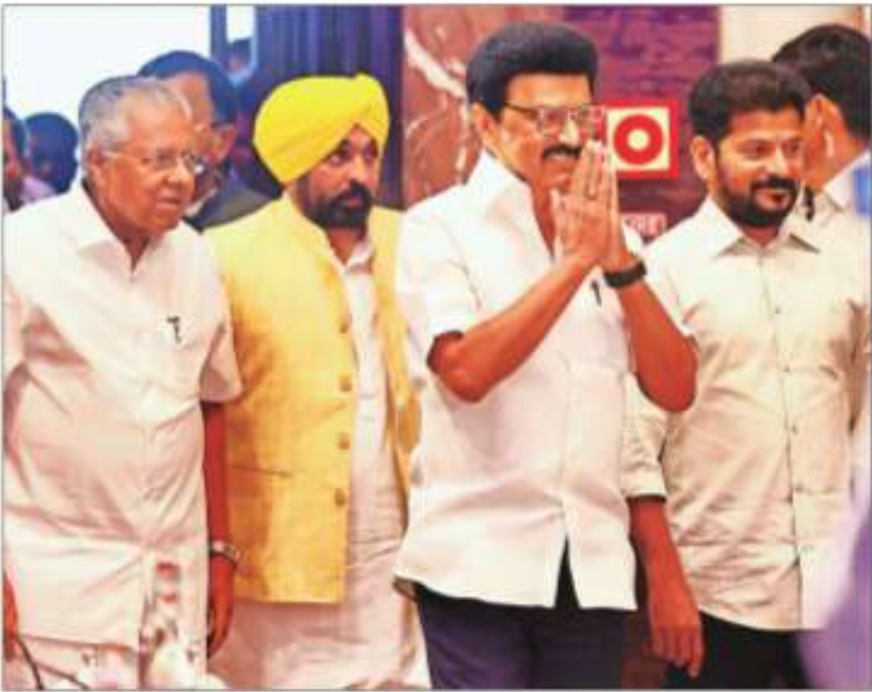
(From left) Kerala chief minister Pinarayi Vijayan, Punjab CM Bhagwant Mann, Tamil Nadu CM MK Stalin and Telangana CM Revanth Reddy at a meeting of states over the proposed delimitation of Parliamentary seats, in Chennai on Saturday

A political consensus also emerged to fight against "population" as the yardstick to determine delimitation and it was resolved during the meeting, which was held to ensure "fair delimitation", not to lose representation for southern states. Politically, the meeting, which was attended by three chief ministers, a deputy CM and leaders of 14 parties including the BRS, BJD and SAD from